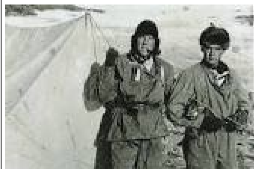
George Mallory e Andrew Irvine