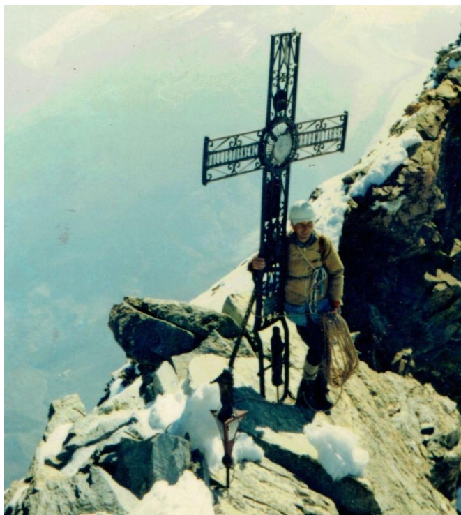
In vetta al Cervino (m. 4478)