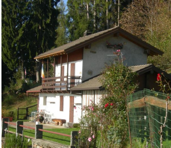
La baita di Pönt

degli Stati Uniti coast to coast , da New York a San Francisco. Al ritorno radunò gli amici, in un generoso convivio, per una proiezione di diapositive di cui diamo qui un solo esempio fotografico dell'attrezzatura impiegata