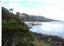
Un ancoraggio tipico nei Canali Cileni del Pacifico