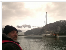
Un ancoraggio nei ghiacciai del Canale di Beagle