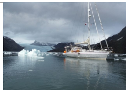
Tra i ghiacci