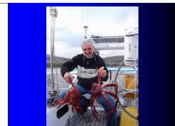
I granchi oceanici giganti di Capo Horn

Venerdì 19 febbraio 2016 ore 21 nella sede del CAI VERBANO a Intra in Vicolo del Moretto 7 (ingresso libero)