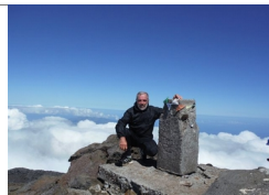
Azzorre in vetta a Pico la più alta montagna del Portogallo