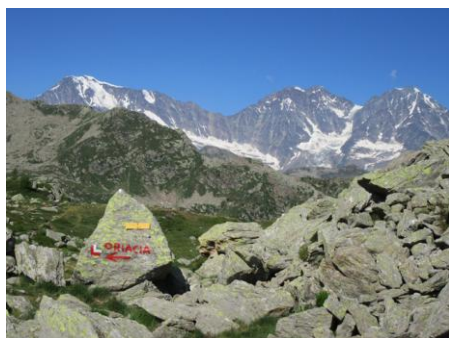
Weissmies Lagginhorn Fletschhorn

Info: Marcello Totolo 328 5433718 - Avio Braconi 335 8475862