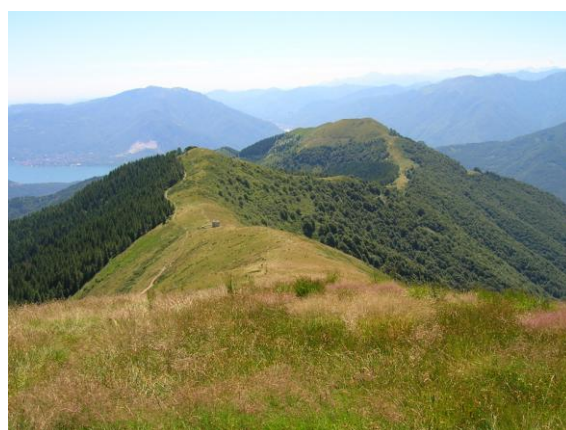
Il Pian Cavallone e Pizzo Pernice dai Balmitt