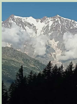
Monte Rosa Parete Est