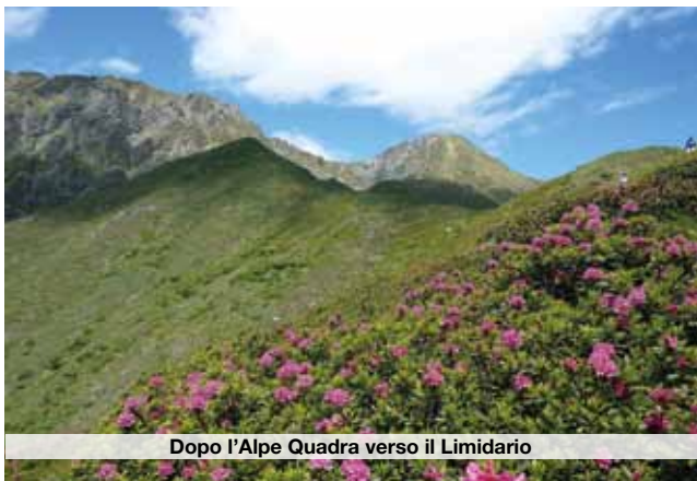
Dopo l'Alpe Quadra verso il Limidario