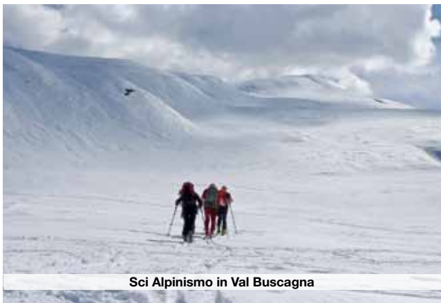
Sci Alpinismo in Val Buscagna