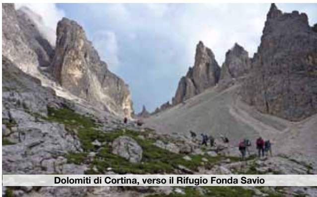
Dolomiti di Cortina, verso il Rifugio Fonda Savio

4) La frequentazione della montagna è soggetta a pericoli che comportano rischi; gli organizzatori ed accompagnatori adottano misure di prudenza e di prevenzione, derivanti dalla normale esperienza, per contenere, in entità e probabilità, tali rischi