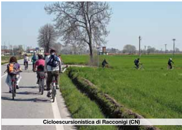
Cicloescursionistica di Racconigi (CN)