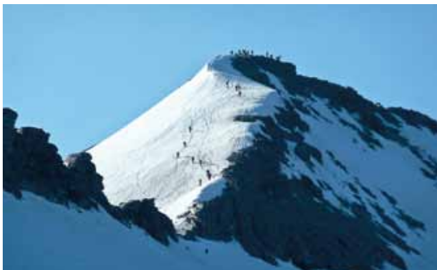
Adula - Canton Ticino (CH)