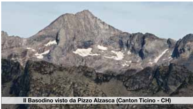
Il Basodino visto da Pizzo Alzasca (Canton Ticino - CH)

Le date e gli itinerari di tutte le gite proposte potrebbero modificarsi per cause di forza maggiore. Chiedere sempre informazioni (in sede al mercoledì e venerdì dopo le ore 21.15 tel.: 0323 405494 - oppure consultare il sito www.caiverbano.it o le locandine esposte nelle bacheche.)