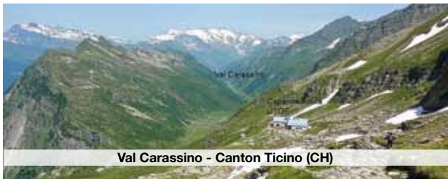
Val Carassino - Canton Ticino (CH)

Difficoltà: E - Dislivello: 750 mt. Tempo di percorrenza 8 ore (Km. 18) Partenza in bus da Verbania per il parcheggio della cabina- via per Rosswald . Il rientro avverrà in bus da Binn Prenotazione obbligatoria entro il 20 agosto Informazioni: M. Canetta 0323 571670 A. Braconi 335 8475862