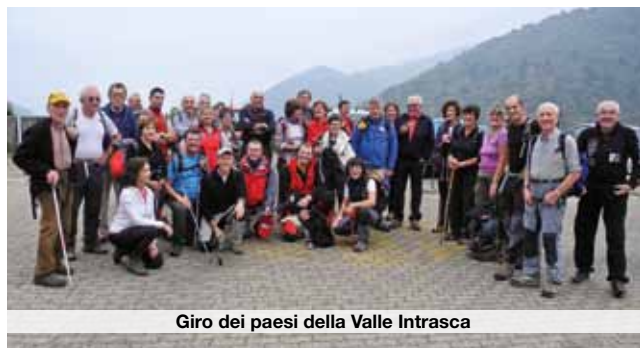
Giro dei paesi della Valle Intrasca