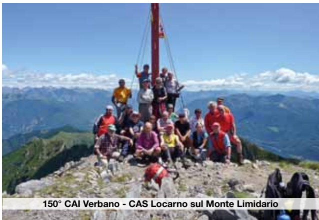
150° CAI Verbanese - CAS Locarno sul Monte Limidario