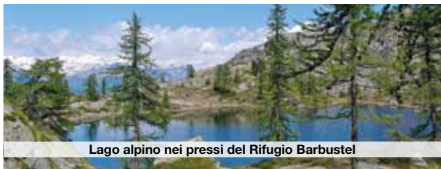
Lago alpino nei pressi del Rifugio Barbustel