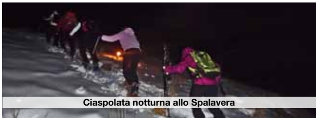
Ciaspolata notturna allo Spalavera