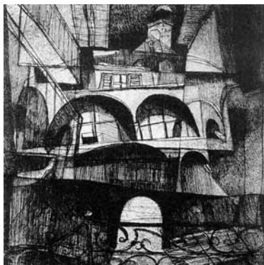
"al n. 7 del Vicolo del Moretto" incisione di Carlo Rapp