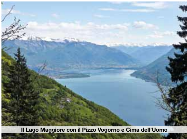
Il Lago Maggiore con il Pizzo Vogorno e Cima dell'Uomo