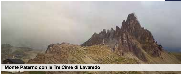
Monte Paterno con le Tre Cime di Lavaredo

Inserita nell'ambito delle manifestazioni di "Letteratura" Cappella Fina-Piancavallone: Difficoltà: E - Dislivello: mt. 450 - Tempo di salita: ore 1,30 Pian Cavallone - Pizzo Marona: Difficoltà EE - Dislivello 500 mt.