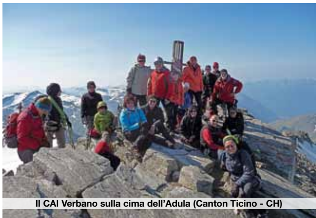
Il CAI Verbano sulla cima dell'Adula (Canton Ticino - CH)