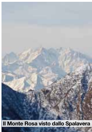
Il Monte Rosa visto dallo Spalavera