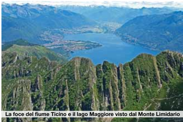
La foce del fiume Ticino e il lago Maggiore visto dal Monte Limidario