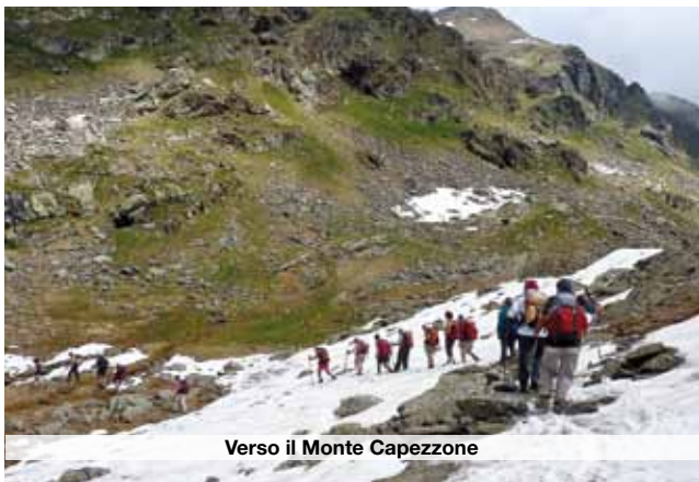
Verso il Monte Capezone