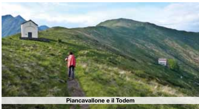
Piancavallone e il Todem