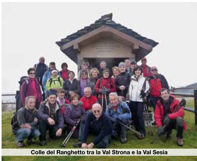
Colle del Ranghetto tra la Val Strona e la Val Sesia