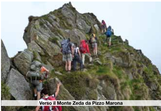
Verso il Monte Zeda da Pizzo Marona