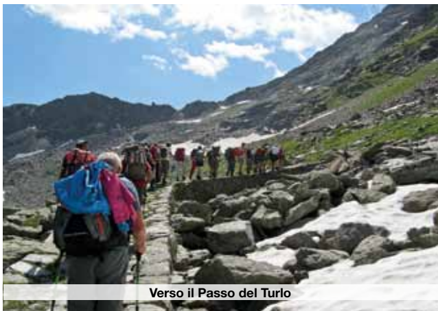
Verso il Passo del Turlo