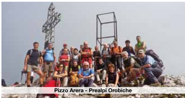
Pizzo Arera - Prealpi Orobie